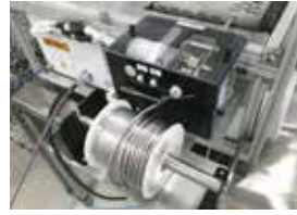
● 自动供锡装置 锡的直径Φ2.0mm